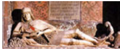
Doncel de Sigüenza