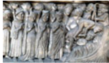
Chartres. Juicio Final