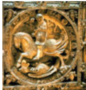
S. Jorge. Generalitat