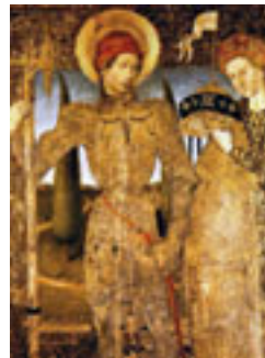
S. Jorge. Huguet