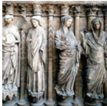
Reims. Anunciación y Visitación