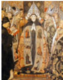
S. Agustín. Huguet