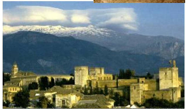
Alhambra de Granada