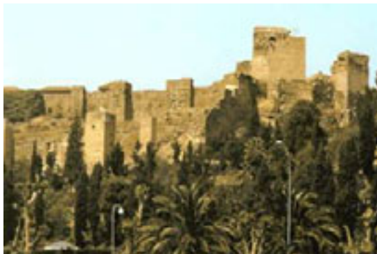
Alcazaba de Málaga