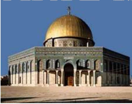
Cúpula de la Roca. Jerusalén

Entre 571 y 632, Mahoma, un comerciante de la Meca, consigue, a través de una nueva religión, el Islam, unificar a las distintas tribus de la península arábiga. Los musulmanes son los que creen en Alá, siguiendo fundamentalmente las enseñanzas de Mahoma depositadas en el Corán. Los sucesores de Mahoma comenzaron un rápido proceso de expansión que llevará al Islam a dominar hasta la India hacia oriente, el Norte de África y la Península Ibérica hacia occidente.