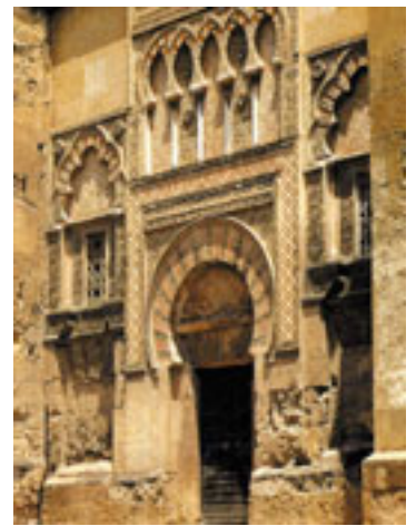
Mezquita de Córdoba