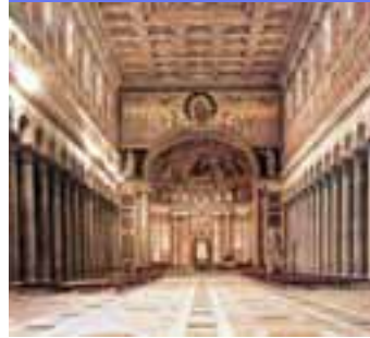
▲ Santa María Santa Sabina ▼